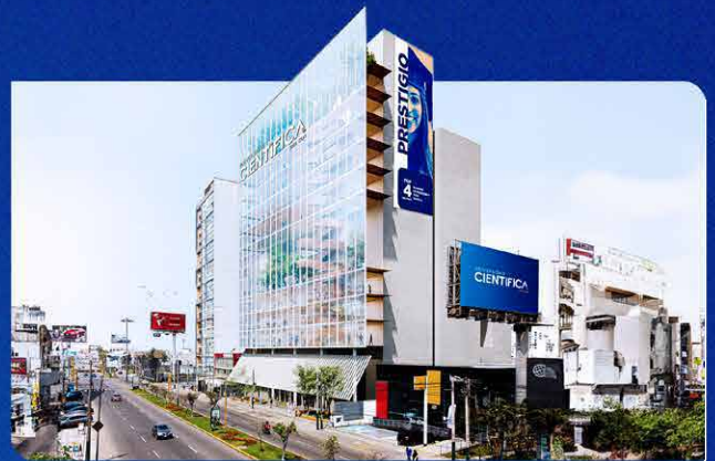
Imagen referencial, construcción a culminar en el 2027.

Av. Nicolás Ayllón 7208 - (altura del km 10.3 de la Carretera Central)