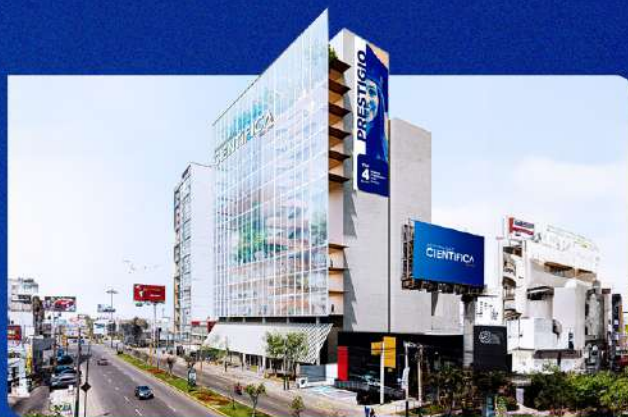
Imagen referencial, construcción a culminar en el 2027.

Av. Nicolás Ayllón 7208 - (altura del km 10.3 de la Carretera Central)