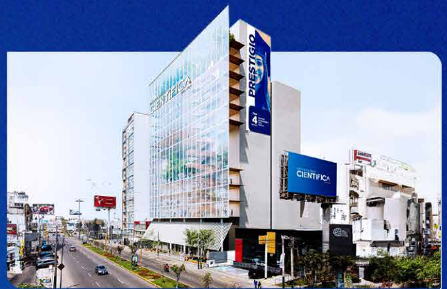
Imagen referencial, construcción a culminar en el 2027.

Av. Nicolás Ayllón 7208 - (altura del km 10.3 de la Carretera Central)