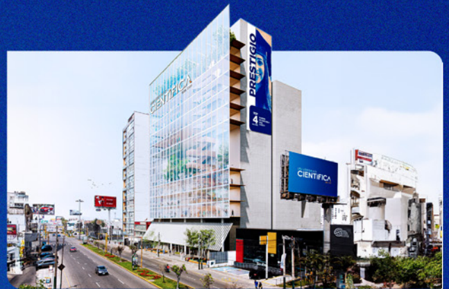
Imagen referencial, construcción a culminar en el 2027.

Av. Nicolás Ayllón 7208 - (altura del km 10.3 de la Carretera Central)