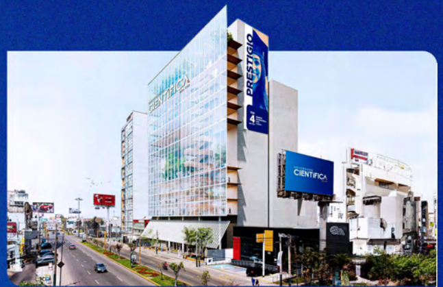
Imagen referencial, construcción a culminar en el 2027.

Av. Nicolás Ayllón 7208 - (altura del km 10.3 de la Carretera Central)