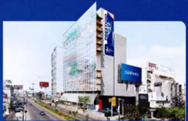
Imagen referencial, construcción a culminar en el 2027.

Av. Nicolás Ayllón 7208 - (altura del km 10.3 de la Carretera Central)