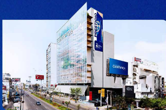
Imagen referencial, construcción a culminar en el 2027.

Av. Nicolás Ayllón 7208 - (altura del km 10.3 de la Carretera Central)