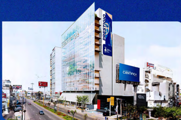
Imagen referencial, construcción a culminar en el 2027.

Av. Nicolás Ayllón 7208 - (altura del km 10.3 de la Carretera Central)